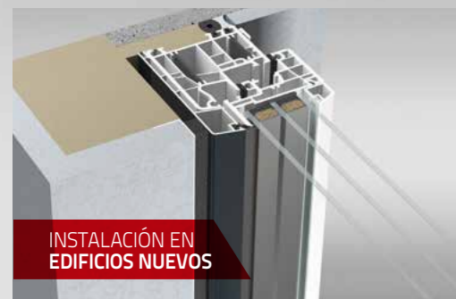
INSTALACIÓN EN EDIFICIOS NUEVOS

Con la tecnología "view", aluplast presenta otra vez una innovación convincente en el área de la construcción de ventanas. ¡Descubra aquí las ventajas en la producción y venta de energeto 5000 view!