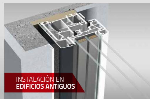
INSTALACIÓN EN EDIFICIOS ANTIGUOS