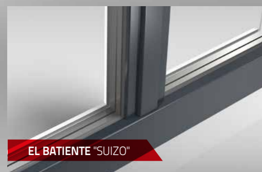
EL BATIENTE "SUIZO"